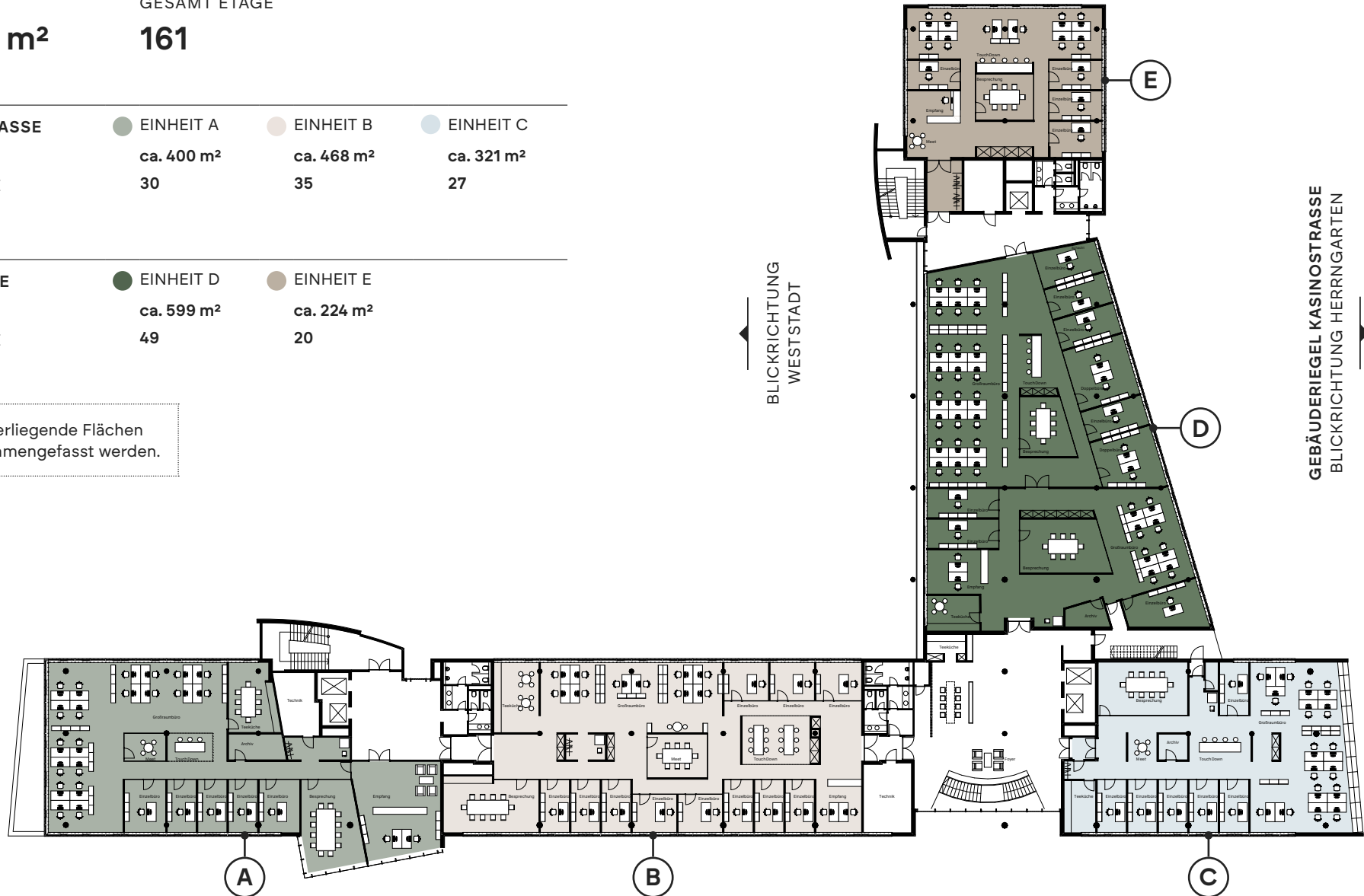
GEBÄUDERIEGEL LANDWEHRSTRASSE BLICKRICHTUNG INNENSTADT

Die dargestellten Grundrisse enthalten eine exemplarische Möblierung. Flächenangaben sind entsprechend in gif-Richtlinien ermittelt und verstehen sich als Schätzwerte. Aufgrund von technischen Anpassungen können sich Änderungen ergeben.