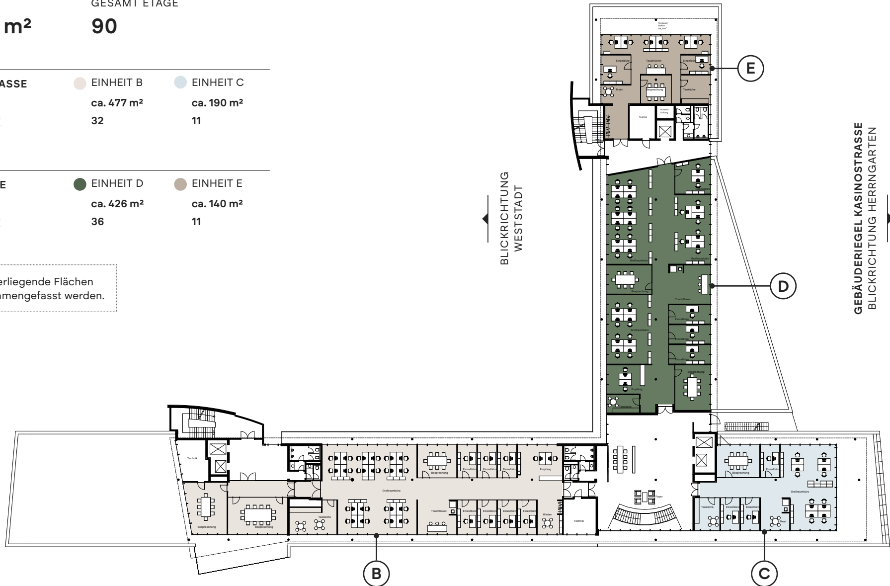
GEBÄUDERIEGEL LANDWEHRSTRASSE BLICKRICHTUNG INNENSTADT

Die dargestellten Grundrisse enthalten eine exemplarische Möblierung. Flächenangaben sind entsprechend in gif-Richtlinien ermittelt und verstehen sich als Schätzwerte. Aufgrund von technischen Anpassungen können sich Änderungen ergeben.