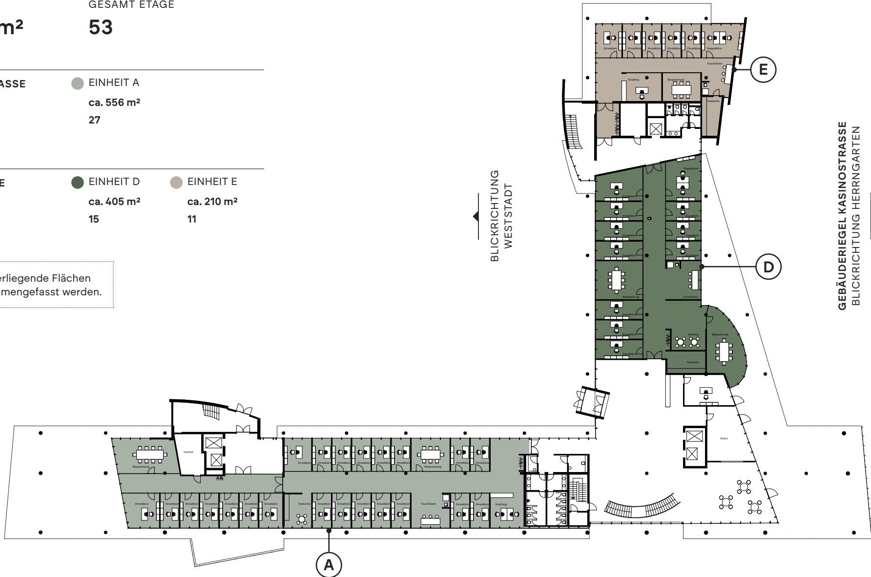
GEBÄUDERIEGEL LANDWEHRSTRASSE BLICKRICHTUNG INNENSTADT

Die dargestellten Grundrisse enthalten eine exemplarische Möblierung. Flächenangaben sind entsprechend in gif-Richtlinien ermittelt und verstehen sich als Schätzwerte. Aufgrund von technischen Anpassungen können sich Änderungen ergeben.